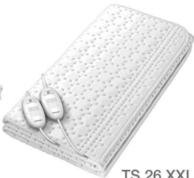
TS 26 XXL